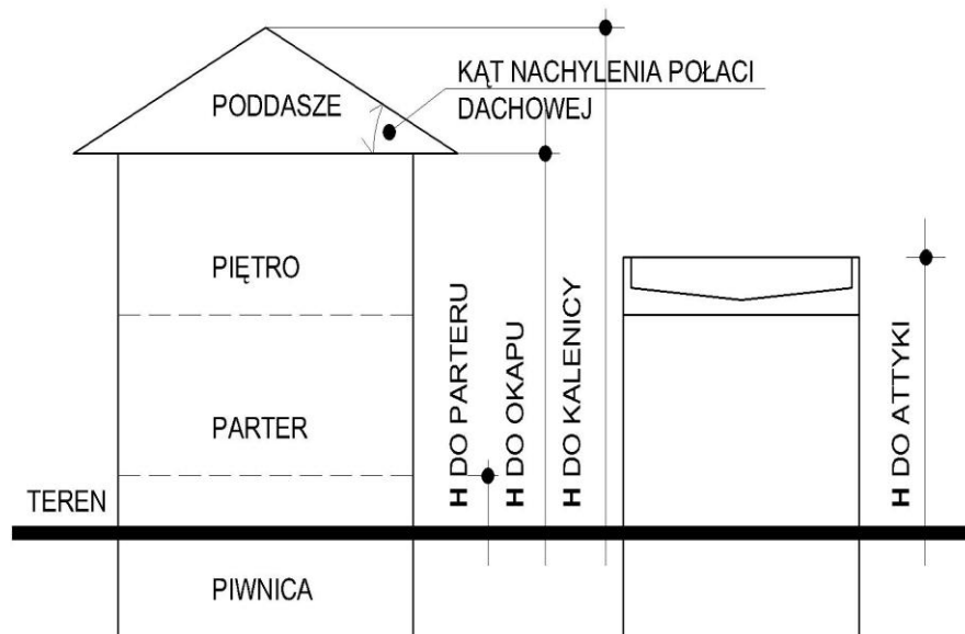
PRZEKRÓJ PIONOWY SKALA DOWOLNA